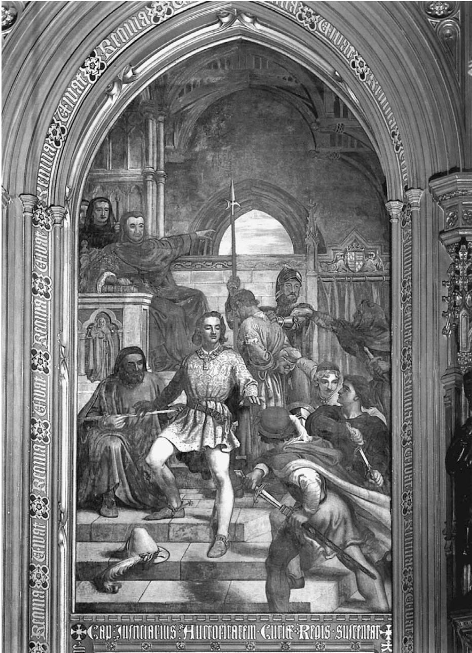
Abb. 5: Prince Henry Acknowledging the Authority of Chief Justice Gascoigne, Charles West Cope, 1849, South Gallery, Lords Chamber, New Palace of Westminster, London (Inv.-Nr. WOA 2966).