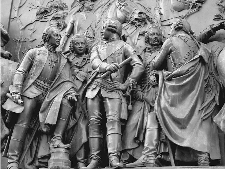
Abb. 8: Denkmal Friedrichs II., Christian Daniel Rauch, Generäle am Sockel, 1851, Unter den Linden, Berlin.

bezeichnet die ursprünglich vorgesehene Entfernung seiner Eckreiter als »diese traurige Kastrirung«. 45 Schinkel und Rauch legten sich wiederholt ins Zeug, um ihre Vorstellung eines Denkmals für Friedrich II. durchzusetzen, zugunsten jener Versammlung von über 30 lebensgroßen Preußen, die seither recht selbstständig auf ihrem Sockel interagieren. Hinter dem Vorwurf des Militarismus, den man dem Denkmal nur zu gerne anhängte, weil fast nur Soldaten den Sockel bevölkern, 46 verschwindet allzu sehr, wie diese überwiegend militärischen Vorbilder des preußischen Staates inszeniert werden. Zum einen ist es nicht nur die Aristokratie, eine Militäraristokratie, die auf den Sockel gehoben wird, sondern eine Meritokratie, also vor allen Dingen diejenigen, die für den Staat etwas geleistet haben, also auch die Gelehrten. Und zum Zweiten wird die Versammlung der Militärs eben nicht im Modus des Habacht oder der berüchtigten friderizianischen geschlossenen Linie im Schräggriff vorgeführt, sondern in einer merkwürdig legeren Zusammenstellung, im Modus des inter se disputando . Teils kehren die Generäle des Alten Fritz dem Betrachter sogar leger den Rücken zu, nur die Eckreiter greifen an ihre Waffen oder erteilen Befehle, überwiegend zeigen sich die Stützen