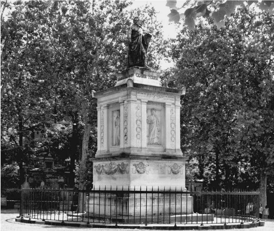
Abb. 1: Grabmal Casimir Périers, Achille Leclère und Jean-Pierre Cortot, 1837, Rond-point, Père-Lachaise, Paris (Foto Verena Kümmel, Universität Münster).

die Allegorie l'éloquence (die Beredsamkeit) dargestellt, im Westen wurde la fermeté (die Standhaftigkeit) und im Osten la justice (die Gerechtigkeit) angebracht. 48 Auf der Rückseite befindet sich die Bauinschrift, die die ausführenden Künstler, die Kommissionsmitglieder und das Fertigstellungsdatum nennt. 49 Gerahmt werden diese Flächen von zwei unkannelierten Pilastern pro Seite, zwischen ihnen jeweils das Relief einer Art Standarte, ähnlich einer Flambeau, deren Stiel von drei übereinander angeordneten Eichenlaubkränzen und Bändern geschmückt wird. Das abschließende Schild trägt die