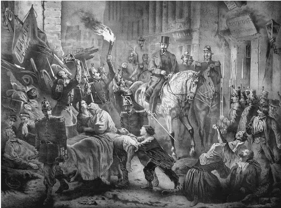
Abb. 8: Louis Napoléon | Ritt in der nacht des 2ten December 1851 (Staatsstreich) durch die Barricaden von Paris, Zeichnung und Lithografie V. G. Bartsch; Druckerei V. J. Hesse, Berlin; Verlag Werner Grosse, Berlin, 39 × 50,5 cm, in: ERNST PITAWALL, Louis Napoleon oder Schicksalskampf und Kaiserkrone. Historisch-romantische Geschichte der Zeit und des Lebens Napoleons III., 3 Bde., Berlin [1868–1869] (Napoleonmuseum Schloss Arenenberg).

unterstreicht somit die Sichtweise der Bonapartisten, die – im Gegensatz zur Pariser Realität – in den Arbeitern (und Bauern) ihre wichtigsten Verbündeten sahen. 62