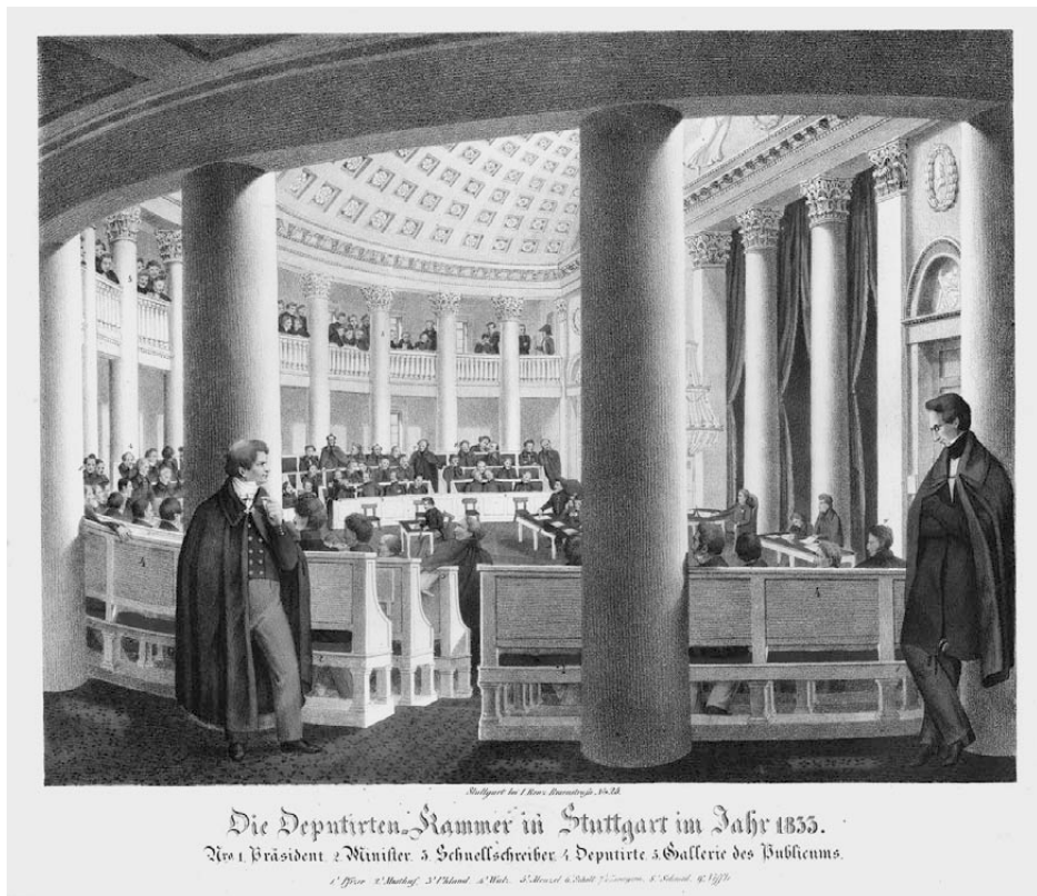
Abb. 1: Paul Pfizer (rechts) im Halbmondsaal des Stuttgarter Landtags, kolorierte Lithografie, 20,4 × 26,3 cm, um 1833 (Städtisches Museum Ludwigsburg, Inv.-Nr. 1835).

Abgeordneten in der württembergischen Kammer zu tragen hatten, 9 nehme sich recht feierlich an ihm aus.